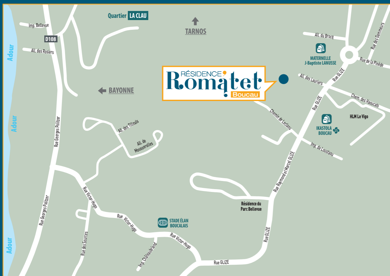
Le programme Romatet à Boucau : Rue Glize

Avec Habitat Sud Atlantic, devenez propriétaire en toute sécurité