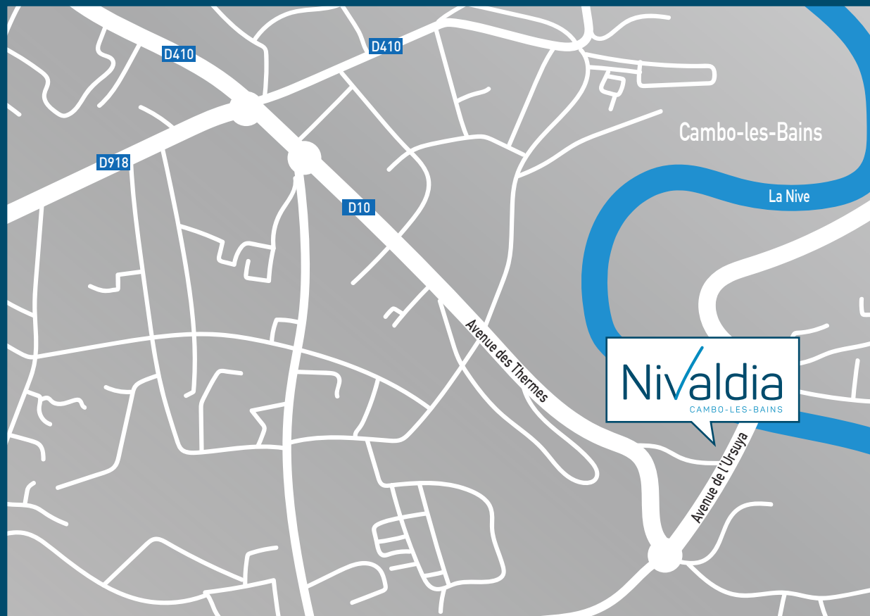
■ Le programme Nivaldia à Cambo-les-Bains

Avec Habitat Sud Atlantic, devenez propriétaire en toute sécurité