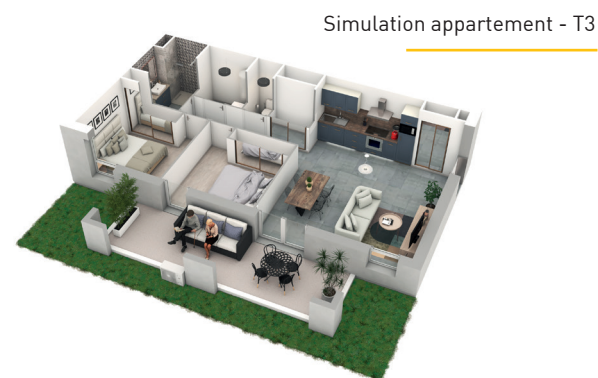
Simulation appartement - T3

La conception des logements est optimisée avec des choix d'orientation privilégiés, des pièces de vie aux surfaces confortables, une isolation renforcée et une perméabilité à l'air permettant un fonctionnement énergétique performant. La construction est soumise à la réglementation environnementale "RE 2020" et sera certifiée "Label NF Habitat HQE".