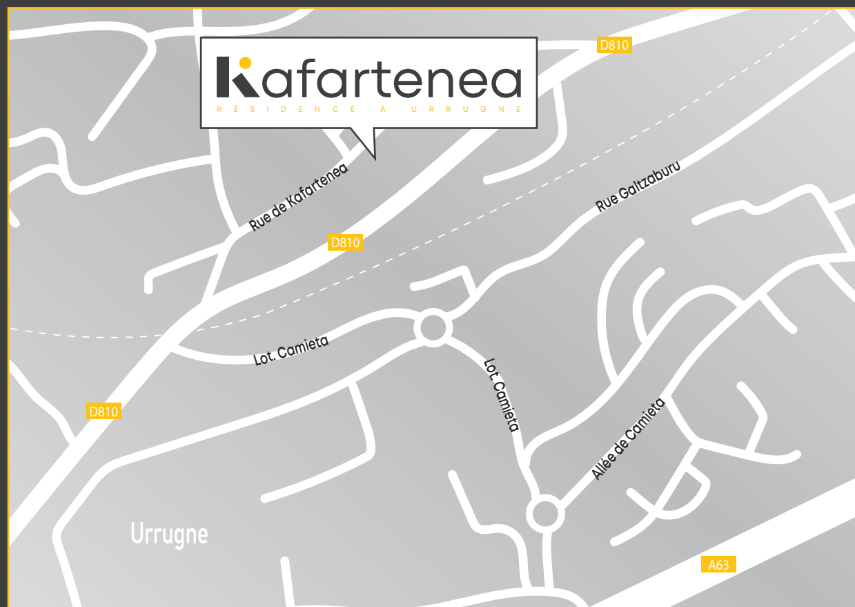
■ Le programme Kafartenea, 15 rue de Kafartenea - Urrugne

Avec Habitat Sud Atlantic, devenez propriétaire en toute sécurité